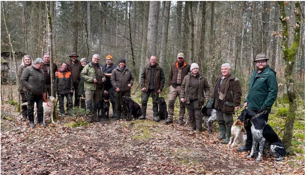
Teilnehmer an der Bringtreueprüfung 29.03.2025