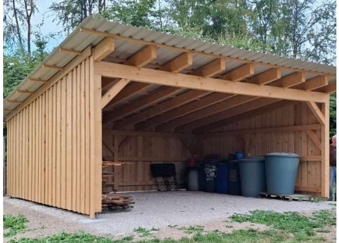
Der neue Schuppen

Vorstand und Gattermeister waren sich schnell einig, dass für die Lagerhaltung von Futter, Stroh und sonstigen Vorräten ein festes Bauwerk entstehen soll.