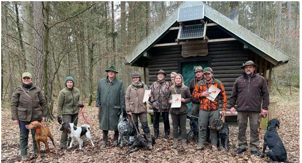
Bringtreueprüfung 15.03.2025 - Teilnehmer und Verbandsrichter