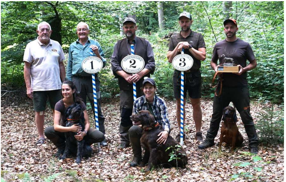
Die erfolgreichen Gespanne 2025 mit den Verbandsrichtern