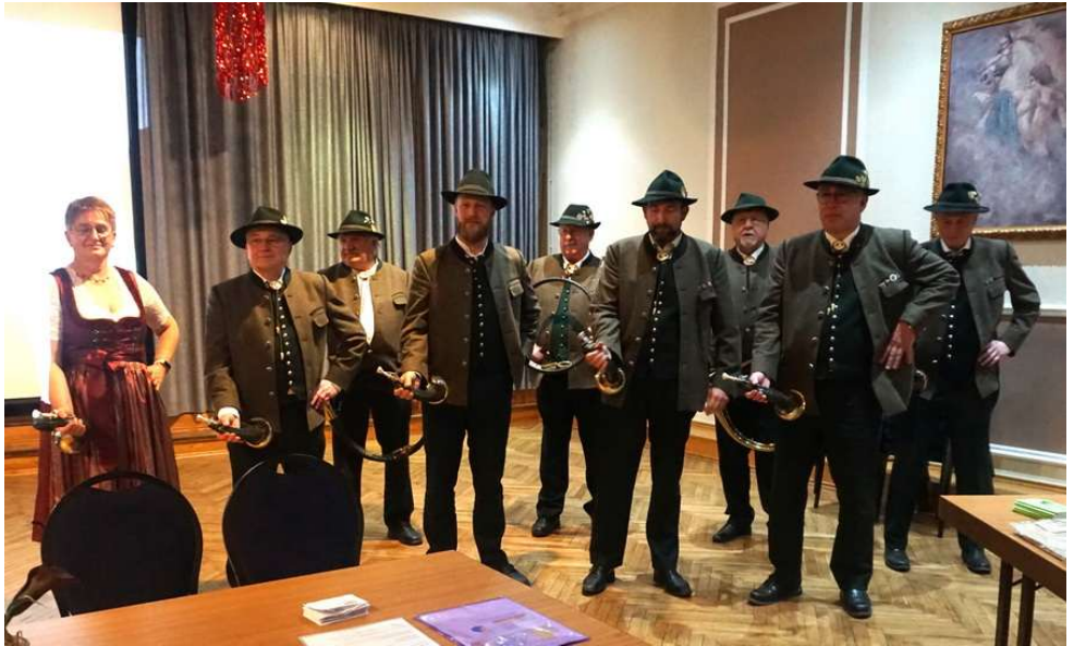
Die Jagdhornbläser des Jagdschutz- und Jägervereins Ingolstadt