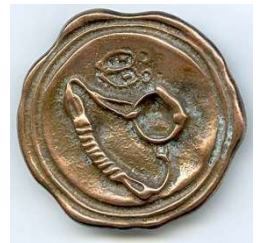
Bronzenes Siegel ab 2005

Die Geisenfelder Nachsuche stellt eine einzigartige Kombination aus realitätsnaher Schweißarbeit, vollständiger Eigenverantwortung der Hundeführer und praxisorientierter Bewertung dar. Wer eine praxisnahe, fordernde und faire Prüfung erleben möchte, dem sei eine Teilnahme an der Geisenfelder Nachsuche empfohlen.